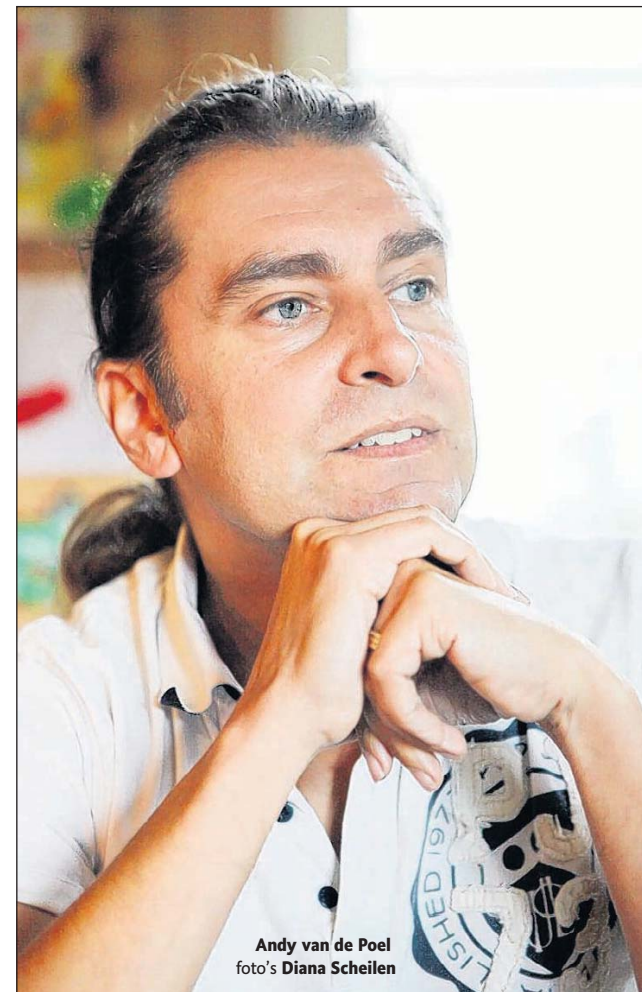
Andy van de Poel foto's Diana Scheilen